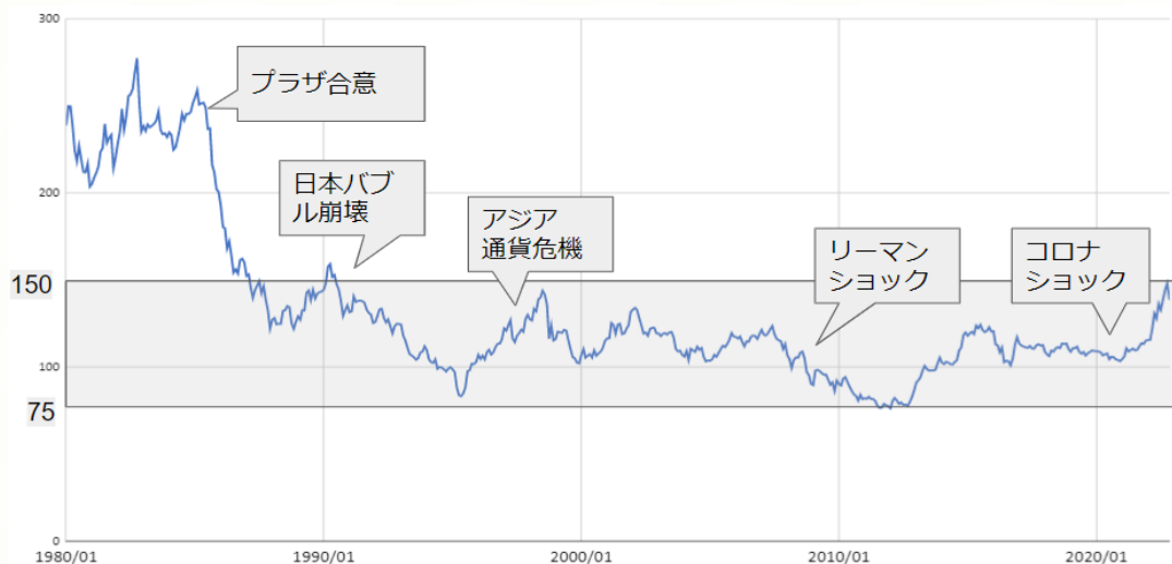
【ドル・円為替レート（1980～2022年）】

1990年以降、円は1ドル約75円から150円の間を推移していることがわかります。コロナ禍、円安が進みました。今後、為替レートがどのように動くかはわかりませんが、過去の長期的な為替の動きをおさえておけば、今はどのあたりにいるのかを冷静に受け止めることもできるのではないのでしょうか？